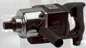
Llaves de impacto con aleación 2934B2SP