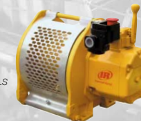
Cabrestante de pistón Force 5

Todos los cabrestantes cuentan con certificación DNV, ABS o LRS.