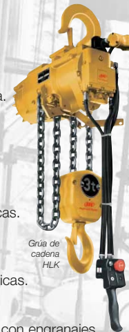
Grúa de cadena HLK