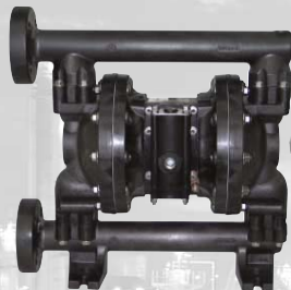
Bomba de la serie de fibra de carbono