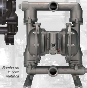
Bomba de la serie metálica