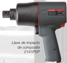
Llave de impacto de composite 2141PSP