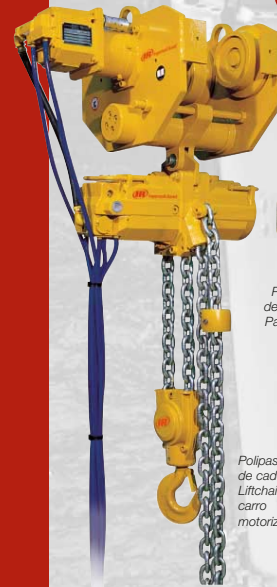
Polipasto de cadena Palair Plus